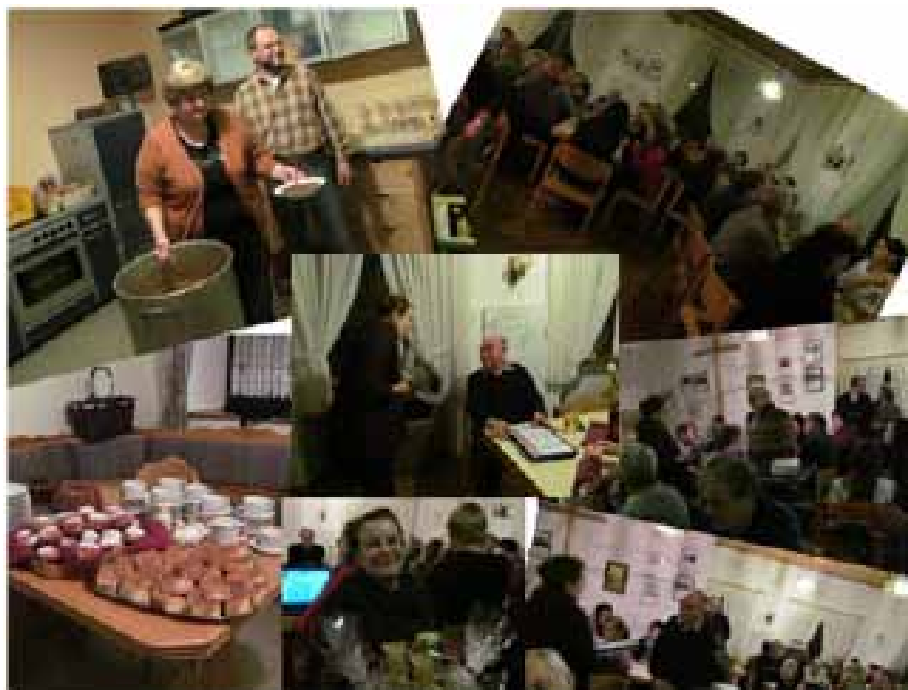
Dankeschön-Abend im Gemeindehaus Püchersreuth am 24. Januar