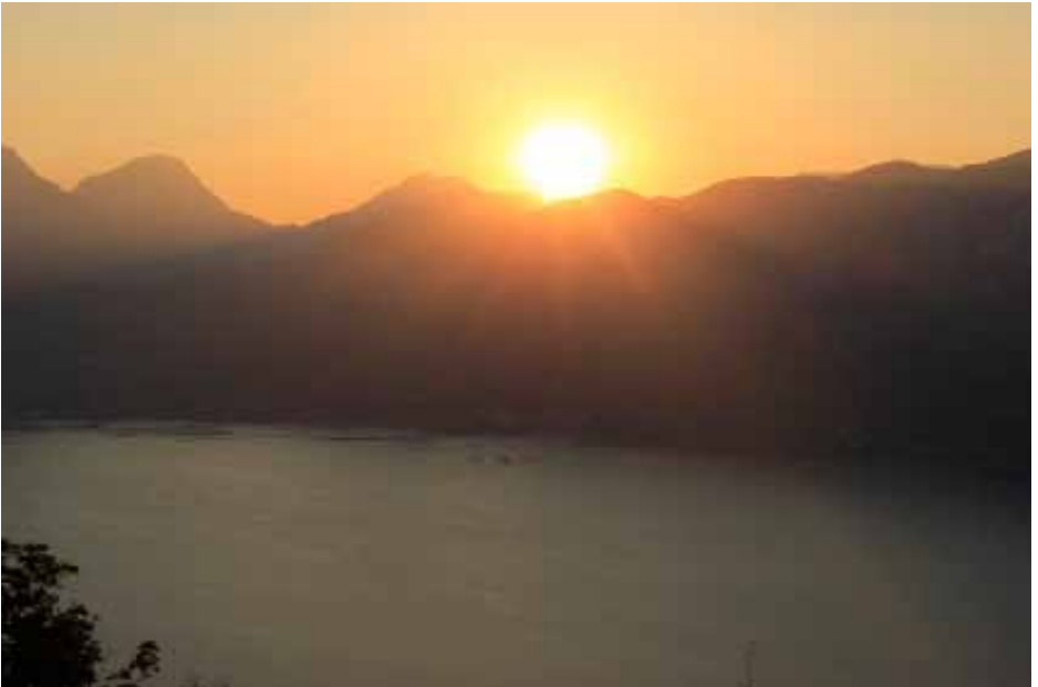
Sonnenuntergang am Gardasee