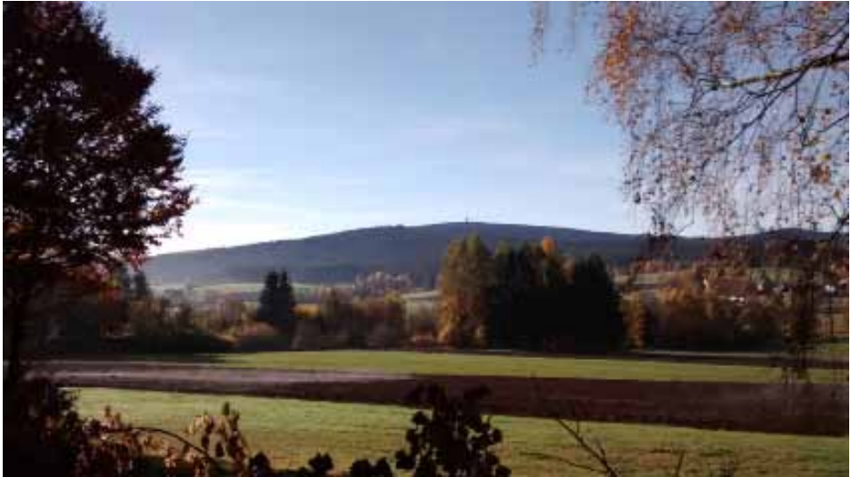
Blick zum Schneeberg im Fichtelgebirge