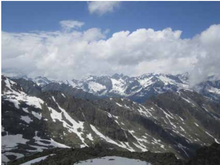
Gebirgskulisse am Feuerstein, Stubai Alpen

„Ich danke dir dafür, dass ich wunderbar gemacht bin!“ Das hat schon der Beter des 139. Psalms erkannt.